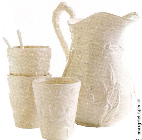
Kan bird € 22,50, be- kertjes bird € 4,50 p. st., porseleinen lepeltjes € 1,35 (Nijhof).